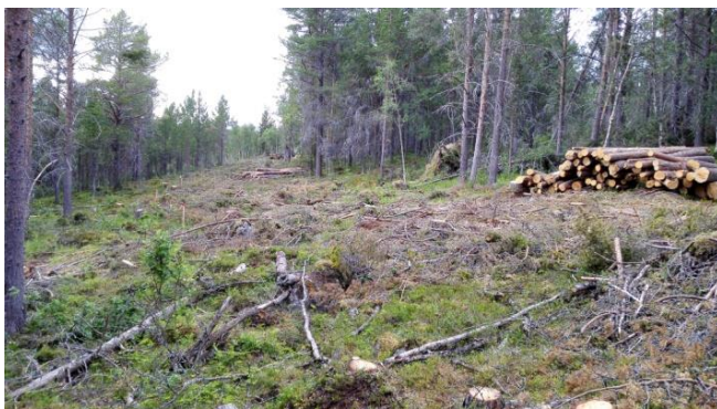
2018- vegtrasè fra fellesområde til vannbehandlingshus

Gjennom vinteren ble det fremført veg, vann, avløp og strøm til tomtene langs nedre vegtrasè. Alle tomter var nå byggeklare, og det som tidligere var 46 mål med tett skog er nå blitt et flott boligfelt! På forsommeren kunne brakke og container fraktes bort.