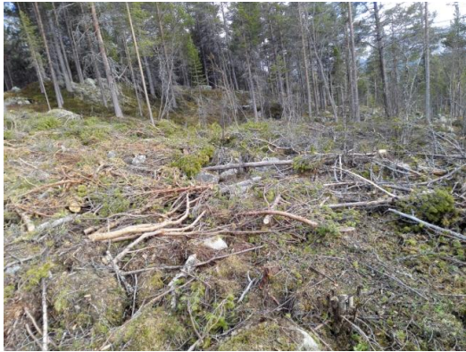
Barnas område før kvistrydding

Det er også gjort en større ryddejobb gjennom sommeren; barnas område og fellesområde samt noen tomter ble ryddet for kvist. En del av kvisten ble hugget til flis. En dugnadsgjeng sørget for å få lagt ut flishaugene som bunndekke i barnas område, hvor det var mye stein og ulendt terreng.