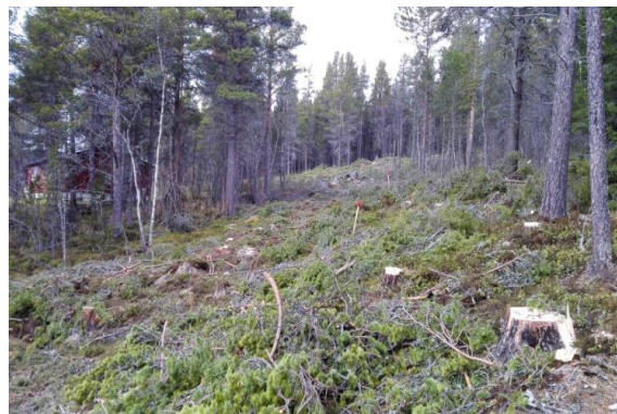
Forberedelse til avkjøring 2018

På våren kom tiden for å forberede oppstart av rensanlegget. I samarbeid med NMBU på Ås var det prosjektert og planlagt et spennende, fremtidsrettet biologisk anlegg, med ny rens teknologi og stedlig sluttbehandling. Anlegget ville oppfylle miljømål som sirkulær økonomi og avfall som ressurs, og skulle brukes som et forskningsanlegg for mastergradstudenter ved universitetet på Ås. Her var spennende forskningstema som: forbedret rens effekt bl.a. for bakterier og virus, vannforbruk, medisinerester i avløp, fosforbinding/gjenvinning, redusert areal for infiltrasjon, m.m. Kommunen hadde tidligere gitt utslippstillatelse til slamskiller, men ville at fylkeskommunen skulle behandle søknad for sluttbehandling. Gjennom hele sommeren var professor/studieveileder ved Ås i kontakt med fylkeskommunen for å få en avklaring vedr. søknad om sluttbehandling, og hvem som var rett mottager. Svarene vekslet mellom fylke og kommune, og før dette ble avklart kunne heller ikke arbeidet starte, vi måtte være sikker på om løsningen ble godkjent. For å få en endelig avklaring ble det avtalt et videomøte i august med representanter fra fylkeskommunen, kommunen, NMBU, Frydenlund VVS og Skurdalen bu- og bygdelag.