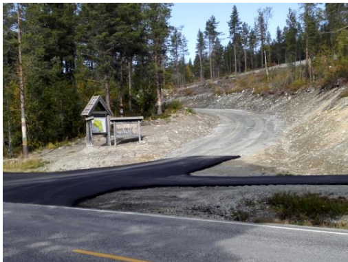
Avkjøring høst 2020

Det ble også en dugnadsjobb for å få flyttet skiltstativet fra Svartesteinstjørn til nytt fundament ved innkjøringen til boligfeltet. Vi fikk også laget to nye skilt, ett stort med "Bu i Skurdalen", og ett skilt med tomtekart, til stativet ved innkjøring. Grendelaget sponset det ene skiltet. På høsten ble avkjøring og gangvegen asfaltert.