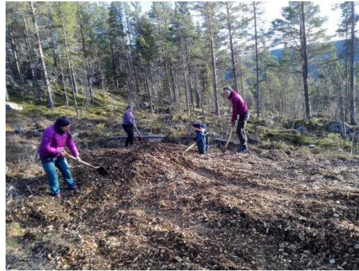
Dugnadsarbeid i barnas område

Det ble også en dugnadsjobb for å få flyttet skiltstativet fra Svartesteinstjørn til nytt fundament ved innkjøringen til boligfeltet. Vi fikk også laget to nye skilt, ett stort med "Bu i Skurdalen", og ett skilt med tomtekart, til stativet ved innkjøring. Grendelaget sponset det ene skiltet. På høsten ble avkjøring og gangvegen asfaltert.