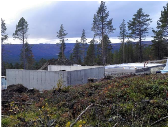
Tomt 9 er klar for husbygging

Vi solgte 3 tomter dette året, den første i april, så fulgte de neste i september og november, som betyr 3 nye hus i 2021. Dette bidrar direkte med nye innbyggere i bygda, og Hol kommune; 1 ny barnefamilie (som har prøvebodd her ett års tid) og 2 tomtekjøpere som tar med egne foretak. Dette er det mest spennende med tomtsalg; man vet ikke hvilke ringvirkninger som følger, i tillegg til nye innbyggere!